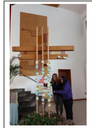
Schuld abladen am Kreuz

Dass Schule ein toller Ort ist, an dem man gerne ist, das ist uns wichtig, dafür beten wir.