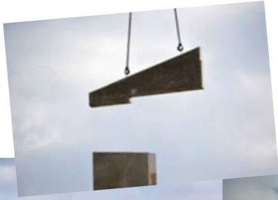
Neubau der Grundschule